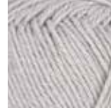
114 Lys antikk