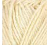
140 Lys gul