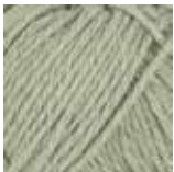
137 Lys mintgrønn