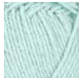
121 Lys aqua