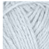
122 Lys blå