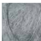
513 Lys grå