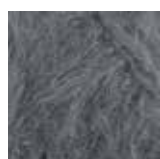
515 Mørk grå