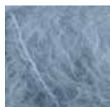
521 Lys gråblå