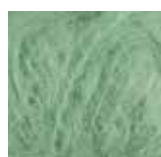
532 Støvet grønn