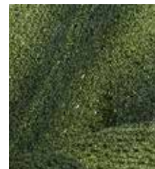
731 Mørk grønn