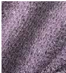
768 Multi lilla