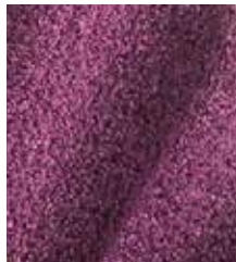
769 Mørk lilla