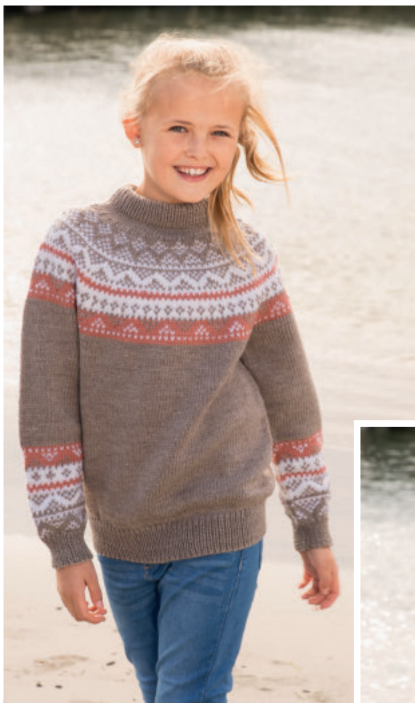
1616-1 «Diis» Design: Turid Stapnes Genser str 10 år Beige nr 607 – 7 n Hvitt nr 600 – 2 n Oransje nr 646 – 1 n