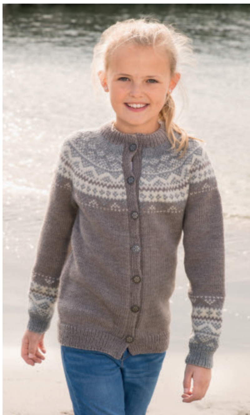
1616-2 «Diis» Design: Turid Stapnes Jakke str 10 år Beige nr 607 – 7 n Lys grå nr 613 – 2 n Naturhvit nr 602 – 2 n