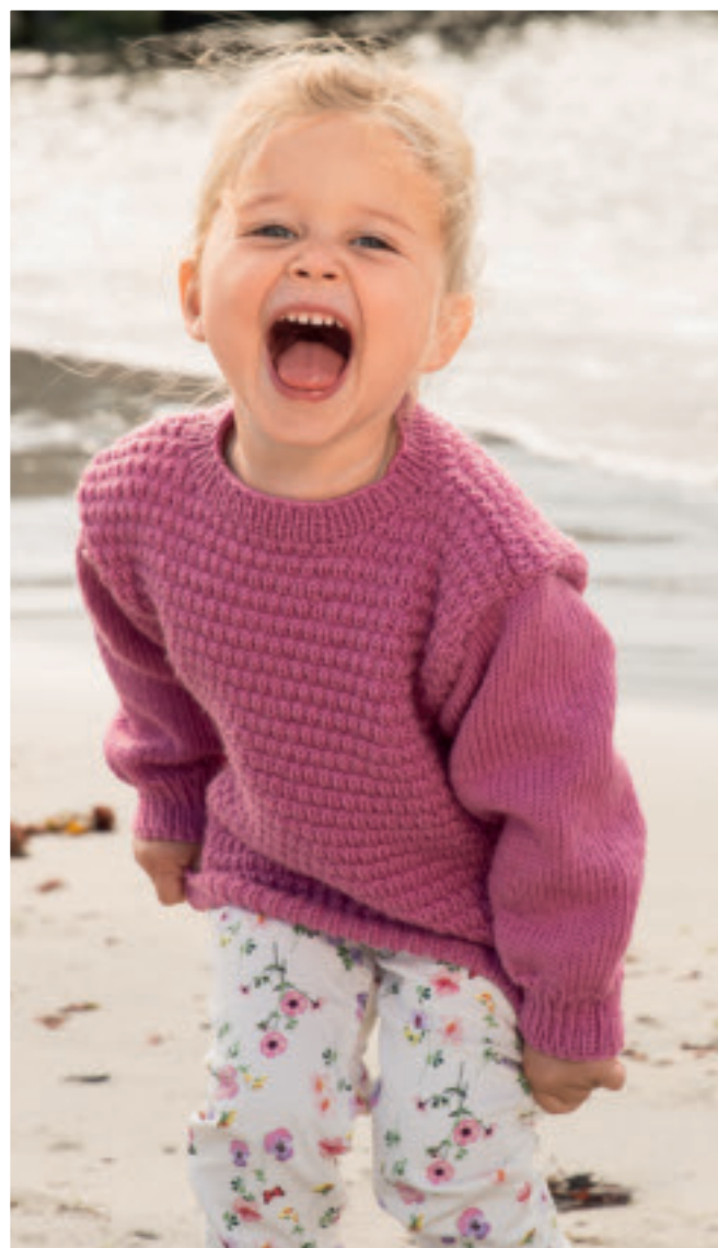
1616-8 «Tuva» Design: Turid Stapnes Genser str 4 år Rosa nr 663 – 6 n