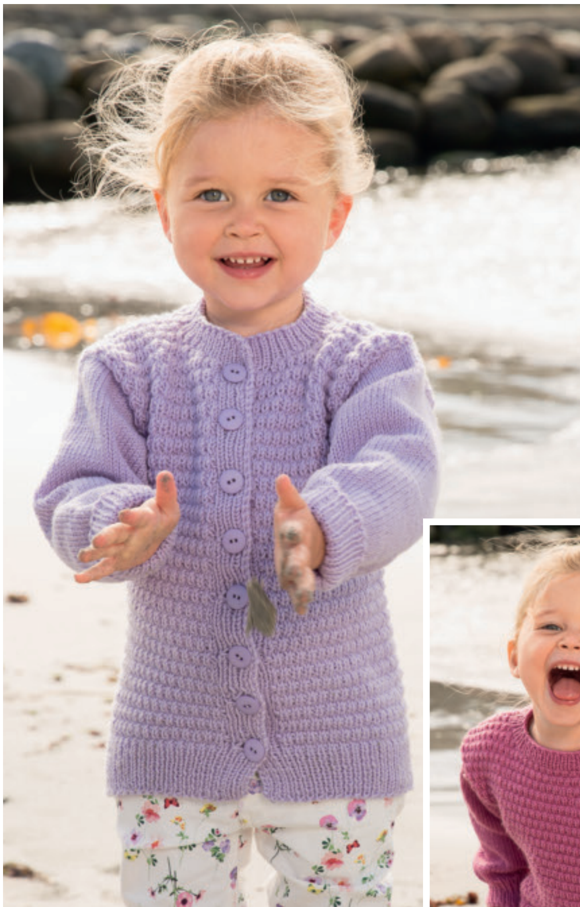
1616-7 «Tuva» Design: Turid Stapnes Jakke str 4 år Lys lilla nr 667 – 6 n